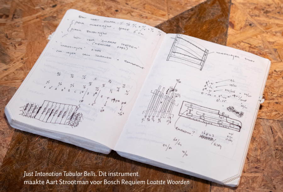
Just Intonation Tubular Bells. Dit instrument maakte Aart Strootman voor Bosch Requiem Laatste Woorden