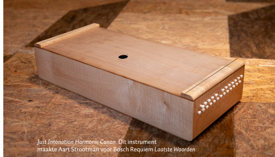
Just Intonation Harmonic Canon. Dit instrument maakte Aart Strootman voor Bosch Requiem Laatste Woorden

8 [5] De een verdrinkt, een ander springt Een derde drinkt zich dood De een sterft in de Efteling Een ander in de goot De een die krijgt een ongeluk Iets stoms in het verkeer De een die gaat van binnen stuk Een ander valt zo neer Bij allen kwam het hier op neer Het hart deed het niet meer Daar komt de dood op neer Het hart doet het niet meer